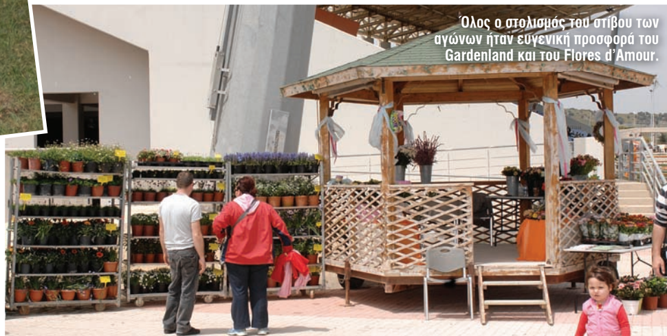
Όλος ο στολισμός του στίβου των αγώνων ήταν ευγενική προσφορά του Gardenland και του Flores d'Amour.