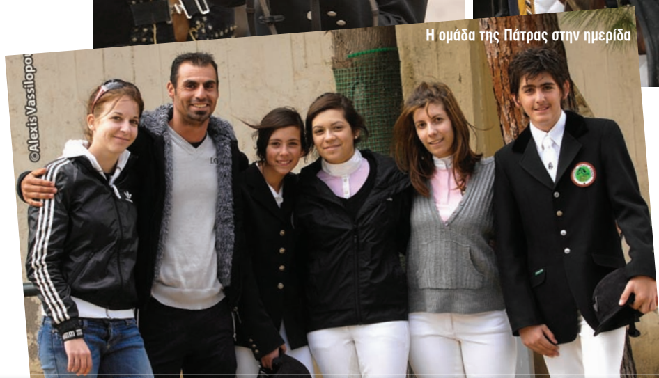
Η ομάδα της Πάτρας στην ημερίδα