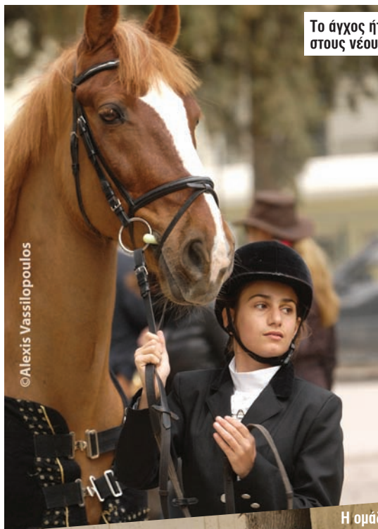
Το άγχος ήταν εμφανές στους νέους αθλητές.

Σ τον Ελληνικό Ιππικό Όμιλο και το Κέντρο Εκπαίδευσης Ιππασίας Θεσσαλονίκης πραγματοποιήθηκε την 1 η Απριλίου αντίστοιχα σε Αθήνα και Θεσσαλονίκη η δεύτερη ημερίδα για την Άδεια Ικανότητας Αθλητού στην υπερπήδηση εμποδίων και την ιππική δεξιότητα. 23 νέοι αθλητές πήραν την άδεια στην υπερπήδηση εμποδίων και την ιππική δεξιότητα, ενώ 13 νέοι αθλητές μόνο στο άθλημα της ιππικής δεξιότητας. Η επόμενη ΑΙΑ έχει οριστεί για το Σεπτέμβριο του 2011.