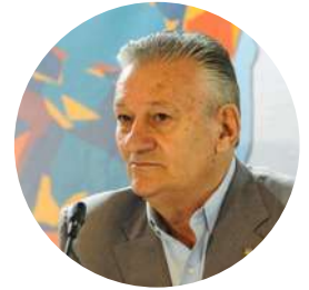
Κώστας Καρακασίλης Πρόεδρος ΕΟΙ

Η ΕΟΙ δεσμεύεται να προχωρήσει με σαφείς στόχους και δράσεις που θα διασφαλίσουν ένα ηθικό, βιώσιμο και ισχυρό μέλλον για την ιππασία. Μαζί με τα σωματεία-μέλη, τους αθλητές και όλους τους εμπλεκόμενους, μπορούμε να δημιουργήσουμε ένα μέλλον όπου οι άνθρωποι, τα άλογα και το περιβάλλον συνυπάρχουν αρμονικά, με αμοιβαίο σεβασμό και υπευθυνότητα.